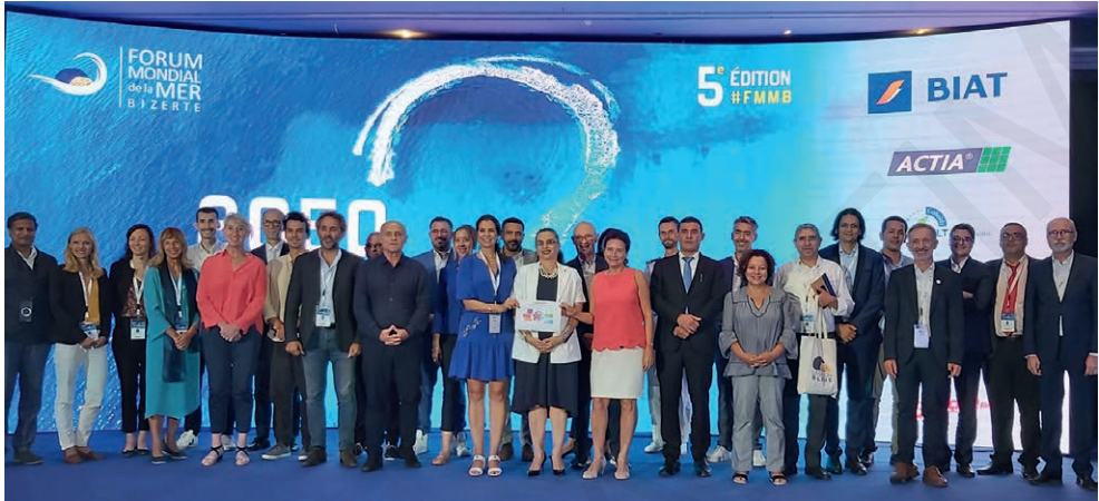
Fig. 7 – Le Forum mondial de la mer à Bizerte (Tunisie), 23 septembre 2022.